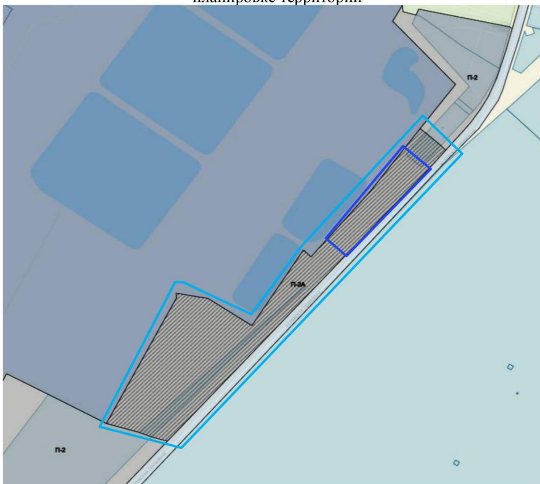
Схема с указанием границ подготовки документации по планировке территории